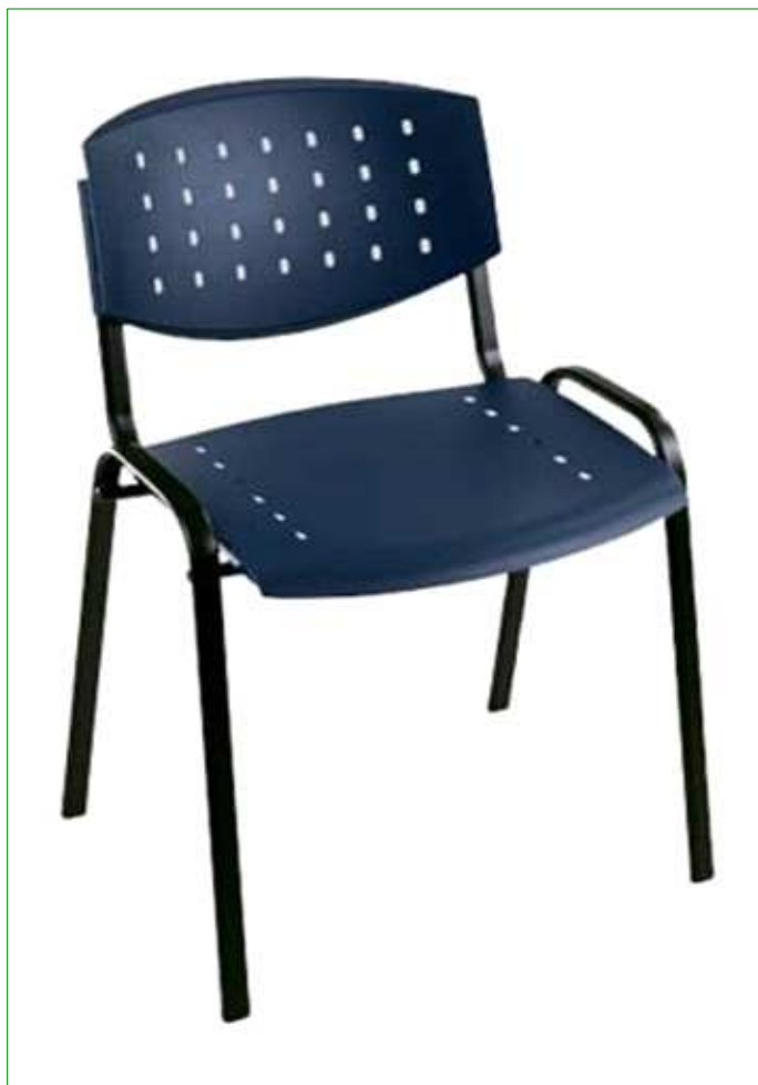
N18 - židle s plastovým sedákem pro klienty

POZNÁMKA: ROZMĚRY JSOU UVEDENY V MILIMETRECH VÍTĚZNÝ UCHAZEČ SI VŠE ZAMĚŘÍ NA MÍSTĚ